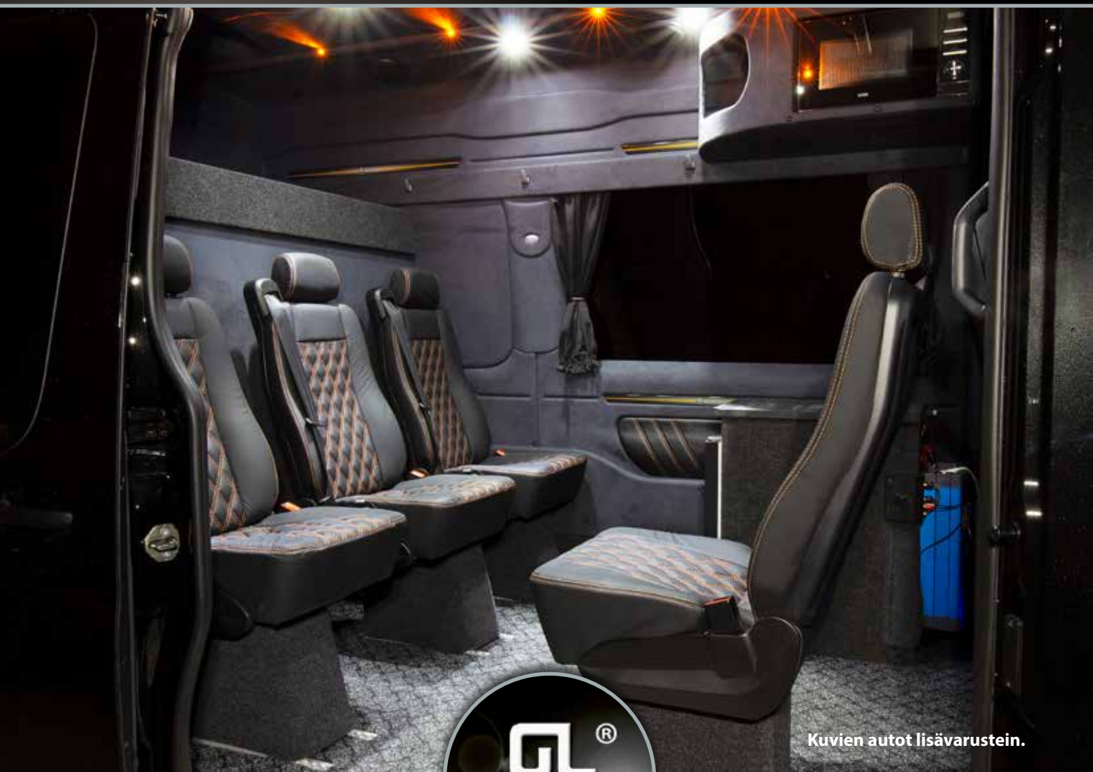
Kuvien autot lisävarustein.